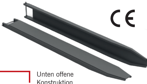
Unten offene Konstruktion