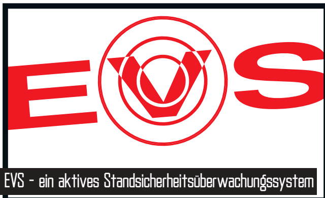
EVS - ein aktives Standsicherheitsüberwachungssystem

Die Kranstützbeine bieten Standsicherheit, aber gleichzeitig müssen sie auch bedienerfreundlich sein und nur wenig Platz aufnehmen. Deshalb bietet HMF folgende wahlfreie Lösungen: Feste Stützbeine, 180° manuell schwenkbare Stützbeine mit Gasfeder oder 180° hydraulisch schwenkbare Stützbeine. Sie können frei zwischen einem hydraulisch ausfahrbaren und einem manuell ausziehbaren Auszugskasten wählen, auch wenn der Kran mit einem fortgeschrittenen EVS Standsicherheitsüberwachungssystem ausgerüstet ist.