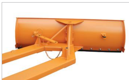
SCH-G links verstellt