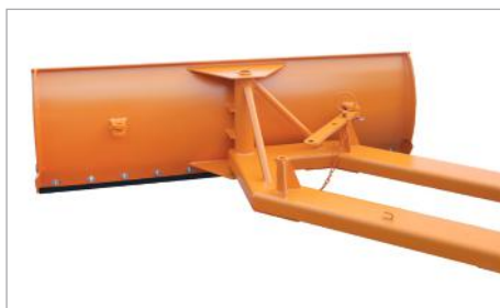
SCH-G rechts verstellt