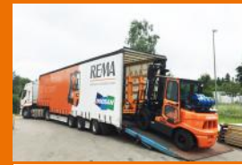
Stapler & Lagertechnik

Top-Angebot: D30GX-Plus 3000 kg, Triplex Hubhöhe 4710 mm, Seitenschieber, SE-Bereifung, Komfortsitz, Yanmar Motor zum Aktionspreis von 18.400,- € (zzgl. MwSt.) (Mietkauf: 72 Monate, monatlich 280,95 € zzgl. MwSt., nur so lange der Vorrat reicht.)